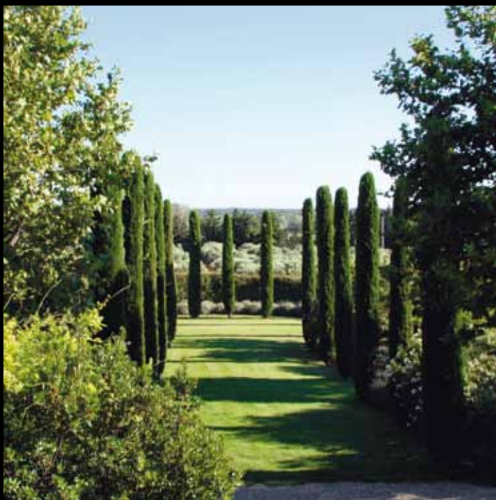
MAUSSANE-LES-ALPILLES / EYGALIÈRES / LES BAUX-DE-PROVENCE / PARADOU / FONTVIEILLE / SAINT-RÉMY-DE-PROVENCE