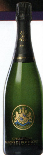
法國羅斯柴爾家族 香檳 (Brut) 0.75L